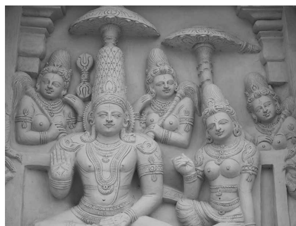
Relief an der Außenseite des Kailasanatha-Tempels in Kanchipuram, Südindien

Gar nicht als Vexierbild kommt für den Betrachter ein Relief am Kailasanatha-Tempel in Kanchipuram, Südindien, daher: Dort