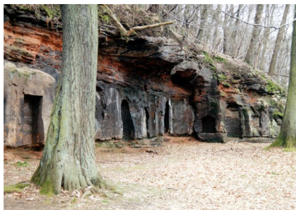
Mithrashöhle oder Heidenkapelle am Halberg in Saarbrücken, direkt unterhalb des Gebäudekomplexes des Saarländischen Rundfunks (Foto: Clemens Zerling).

DIE GESCHICHTE ABER WOLLTE ES ANDERS. VON DEM MYSTERIENKULT UM MITHRAS ERZÄHLEN HEUTE NUR NOCH DIE VIELEN RÄTSELHAFTEN FUNDE, DIE DIE ARCHÄOLOGEN VERMEHRT SEIT DEM 19. JAHRHUNDERT ANS LICHT GEBRACHT HABEN.